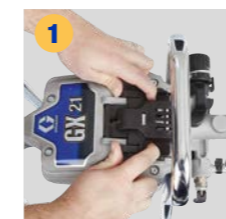
Przesuń i unieś drzwiczki dostępne