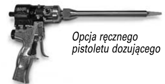
Opcja ręcznego pistoletu dozującego