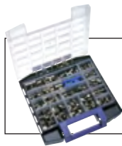
Multibox RiB Steckanschlüsse MSV von 4 bis 8 mm auf Seite 958