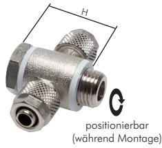
positionierbar (während Montage)