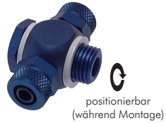
positionierbar (während Montage)