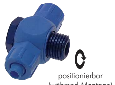
positionierbar (während Montage)