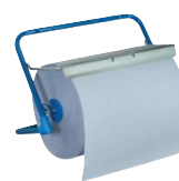
Typ PUTZR ABROLLW