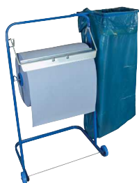
Typ PUTZR ABROLL