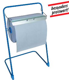
Typ PUTZR ABROLL B