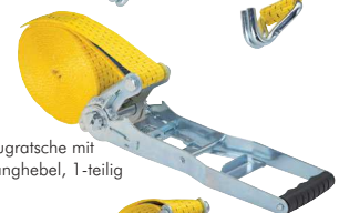
Zugratsche mit Langhebel, 1-teilig