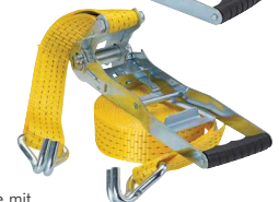
Zugratsche mit Langhebel, 2-teilig mit Spitzhaken

Alle Angaben verstehen sich als unverbindliche Richtwerte! Für nicht schriftlich bestätigte Datenauswahl übernehmen wir keine Haftung. Druckangaben beziehen sich, soweit nicht anders angegeben, auf Flüssigkeiten der Gruppe II bei +20°C.