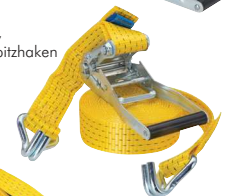
Druckratsche, 2-teilig mit Spitzhaken