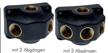
mit 2 Abgängen