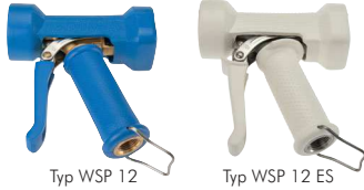
Typ WSP 12