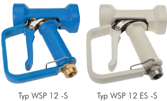
Typ WSP 12 -S