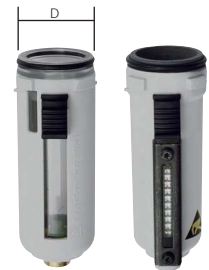
Typ BOL 1 F Typ BOLM 1 F

* ohne Schutzkorb, auf Wunsch kann ein Schutzkorb hinzubestellt werden. Schutzkörbe finden Sie bei der Serie „Multifix“ auf Seite 598, ** ohne Sichtrohr