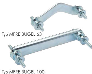
Typ MFRE BUGEL 63

Werkstoffe: Bügel und Gewindestifte: Stahl verzinkt