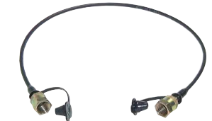
Typ ME SL 162/...