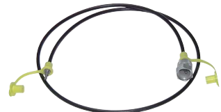
Typ ME SL ST 162/1000