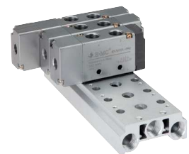
für 5/2-Wege & 5/3-Wege Ventile