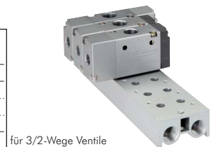
für 3/2-Wege Ventile