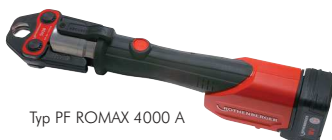
Typ PF ROMAX 4000 A